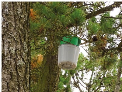
Piège à phéromones

La CCPF intervient pour limiter les populations de chenilles processionnaires sur le domaine public :