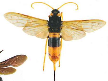
Sirex géant, Urocerus gigas

Le sirex géant est un Hyménoptère dont la larve se nourrit de bois. La femelle peut atteindre 4,5 cm, a une coloration proche du frelon asiatique, mais s'en distingue facilement par des antennes longues entièrement jaunes ainsi que par la présence d'une longue tarière lui permettant de pondre dans le bois. Cet insecte est inoffensif.