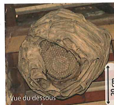
Vue du dessous