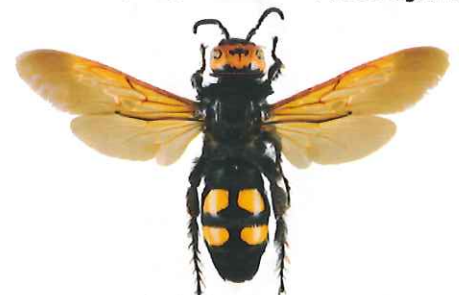
Scolie des jardins, Megascolia maculata flavifrons

La scolie des jardins fait partie des plus imposantes "guêpes" européennes. Elle est de ce fait fréquemment confondue avec le frelon asiatique. Sa pilosité est très épaisse. Son corps est noir brillant, sa tête est jaune sur le dessus et elle possède 4 zones jaunes et glabres sur l'abdomen. C'est un parasite de larves de gros Coléoptères (comme le Hanneton).