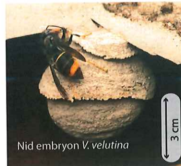
Nid embryon V. velutina

Au printemps, chaque reine fondatrice construit seule son nid dans un lieu souvent protégé. Chez la plupart des guêpes le nid embryon ressemble à une petite sphère de 5 à 10 cm de diamètre avec une ouverture vers le bas. Chez les frelons, la colonie n'hésitera pas à déménager si l'emplacement ne convient plus (manque de place, de sécurité).