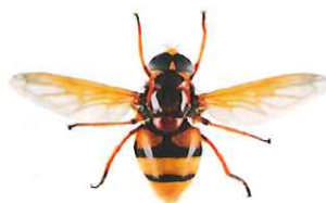
Volucelle zonée, Volucella zonaria

De nombreuses mouches (Diptères) peuvent ressembler à des guêpes ou des frelons. Mais à la différence de ceux-ci elles ne possèdent qu'une seule paire d'ailes au lieu de deux. Leurs yeux sont généralement beaucoup plus globuleux et leurs antennes plus courtes.