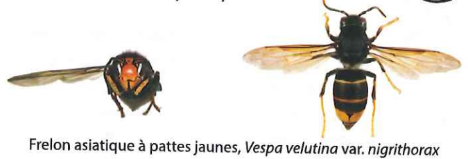
Frelon asiatique à pattes jaunes, Vespa velutina var. nigrithorax

Le frelon asiatique à pattes jaunes, Vespa velutina , est à dominante noire, avec une large bande orange sur l'abdomen et un liseré jaune sur le premier segment. Sa tête vue de face est orange, et les pattes sont jaunes aux extrémités. Il mesure entre 17 et 32mm.