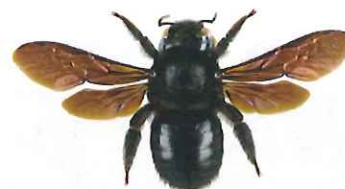
Xylocope ou abeille charpentière, Xylocopa violacea

L' abeille charpentière mesure entre 2 et 3 cm. C'est l'une des plus grandes abeilles européennes. Elle est entièrement noire avec des reflets bleu violacés. Elle construit son nid dans le bois mort et nourrit ses larves de pollen.