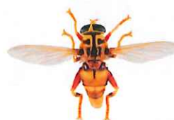
Milésie faux-frelon, Milesia crabroniformis