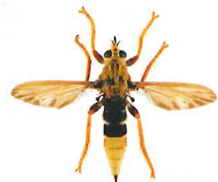
Asile frelon, Asilus crabroniformis