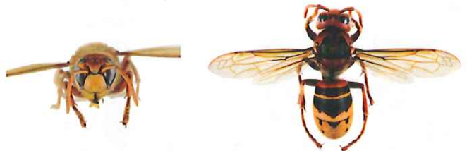
Frelon d'Europe, Vespa crabro

Le frelon d'Europe , Vespa crabro , a l'abdomen à dominante jaune clair, avec des bandes noires. Sa tête est jaune de face et rouge au dessus. Son thorax et ses pattes sont noirs et brun-rouges. Les ouvrières mesurent entre 18 et 23mm et les reines entre 25 et 35.