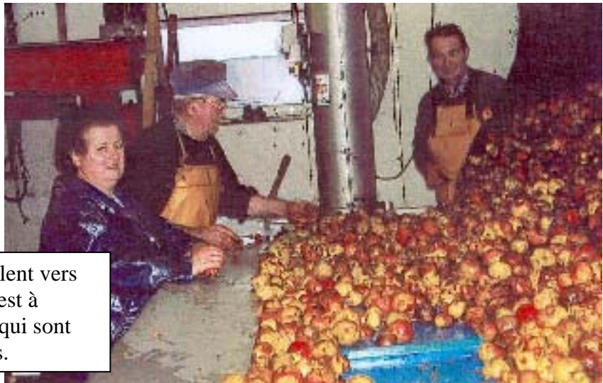
Tandis que les pommes roulent vers le broyeur, toute la famille est à l'œuvre pour écarter celles qui sont gâtées et les corps étrangers.