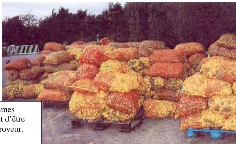
Les sacs de pommes s'entassent avant d'être dirigés vers le broyeur.