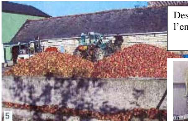
Des montagnes de pommes et, derrière, l'engin qui vient les charger.