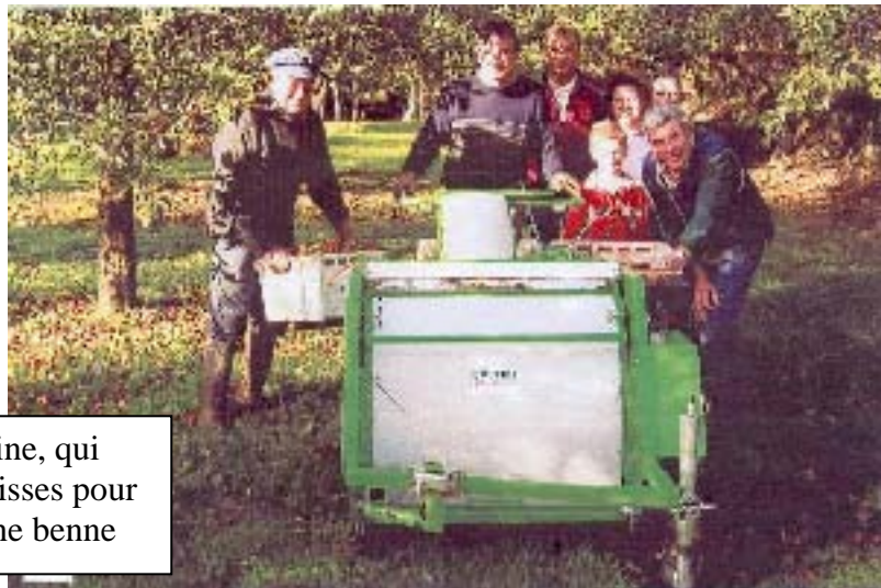
Ramassage à la machine, qui met les pommes en caisses pour être déversées dans une benne