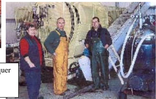
Dans la salle des machines : remarquer la puissante presse hydraulique horizontale.