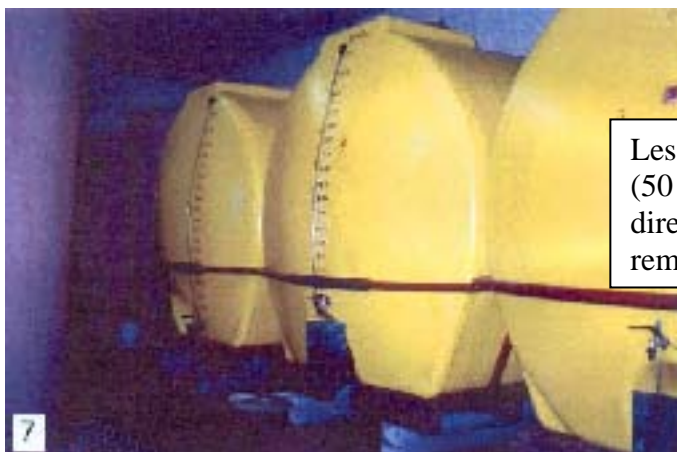
Les énormes cuves en plastique (50 hectolitres chacune, c'est-à-dire plus de 22 barriques) ont remplacé les fûts de chêne.