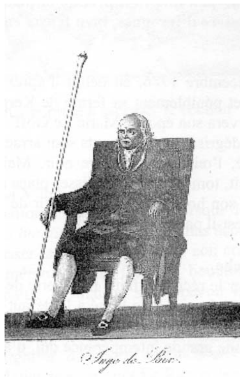
Juge de paix sous le Directoire.

Ce qui sera chose faite car la plainte a été classée. Voilà donc l'exemple d'une médiation pleinement réussie !