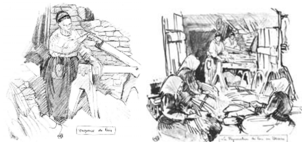
Dessins de Mathurin MEHEUT

Ceci étant dit, il ne nous parait pas inutile de consacrer quelques lignes aux étoffes citées dans nos inventaires.