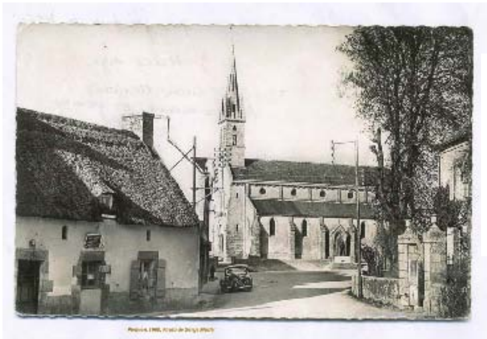
Le bourg de Pleuven en 1960. Il ressemble encore à ce qu'il était en 1930.

Considérant que le projet en question répond à un besoin réel, décide, en principe, l'installation d'une pompe dans le bourg et autorisant le Maire de se mettre en relation avec une personne compétente pour les travaux et dépenses à envisager.