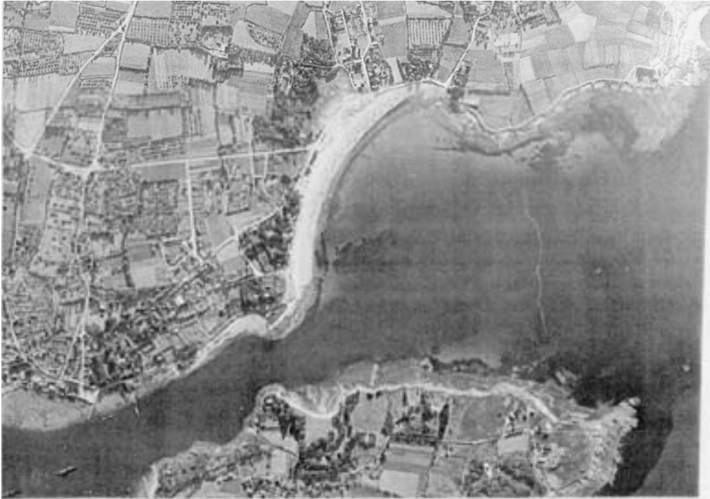
Dragueurs allemands au port de Bénodet

A gauche, sur la photo, on distingue deux navires allemands au mouillage. Entre le rivage de Bénodet et celui de Sainte Marine, une ligne blanche signale le barrage anti-sous-marins. Sur la plage du Trez, on distingue les défenses anti-chars.