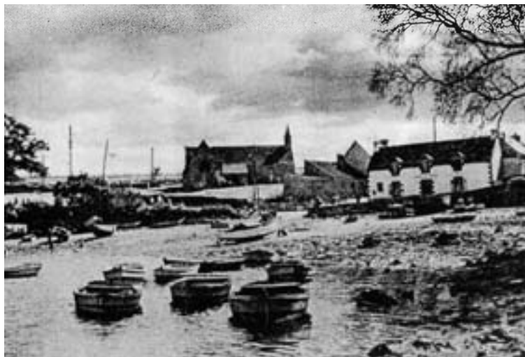
Le petit port de Sainte Marine vers 1930

La vie s'organise rapidement, les matelots anglais n'ont pas mis longtemps à découvrir un petit restaurant qui distribue des œufs au plat avec une tranche de jambon, les Français assiègent les deux pâtisseries qui, le jeudi et le dimanche, servent des choux à la crème ; on peut se baigner sur la plage et dans ce pays de cocagne, où l'on habite en pleine ville, dans un hôtel civil, et où le "service" est réduit à son strict nécessaire, on s'aperçoit qu'il y a des mariages quotidiennement, que tous les jours sont fêtes et que le "lambic " coule encore à flots.