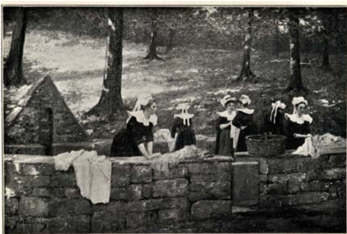
LE FOURNIS (J.). Lavoir à Fouesnant.