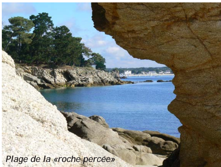
Plage de la « roche percée »